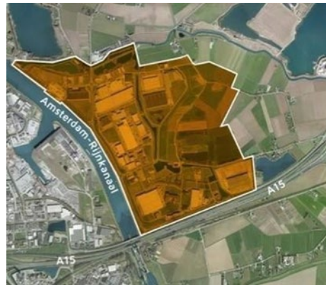
Figuur 2. Luchtfoto locatie Bedrijvenpark Medel

Naast ervaring en kennis biedt de terminal het park een grote hoeveelheid extra faciliteiten zoals op- en overslag, koeling, vervoltransport per boot of vrachtwagen, weging en verhuur van containers. Een keur aan specialistische diensten die het logistieke traject stroomlijnen.