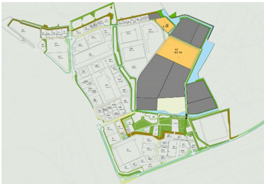
Figuur 4. Kavelkaart

Zie voor meer specifieke informatie per Kavel, de Kavelpaspoorten in bijlage 2.